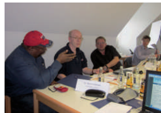
Fotos: Arbeitsgruppen bei früheren Seminaren in Montabaur