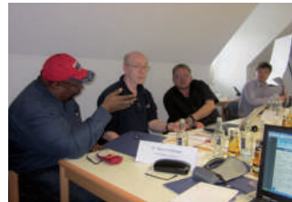
Fotos: Arbeitsgruppen bei früheren Seminaren in Montabaur