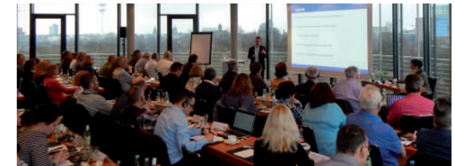
Dernier séminaire avant la pandémie de Corona en janvier 2020 avec près de 70 participants de neuf pays.

L'hôtel Port Hambourg est situé au-dessus des débarcadères de Sankt Pauli et nous offre une vue impressionnante sur le port et l'Elbe pendant le séminaire. Nos chambres se trouvent dans le nouveau bâtiment de l'hôtel, dans la « Résidence des cabines », et séduisent par leur charme moderne et leur confort.