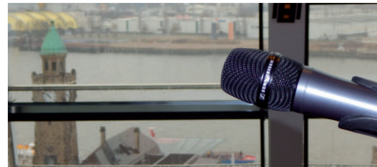
Vue sur les St. Pauli Landungsbrücken depuis la salle de conférence

Les membres des comités d'entreprise européens des pays de l'UE ainsi que du Royaume-Uni, de la Norvège, de l'Islande et du Liechtenstein peuvent se référer à l'article 10, paragraphe 4 de la directive européenne 2009/38/CE pour obtenir une prise en charge des frais et un congé auprès de la direction centrale. En général, l'accord CEE ou l'accord de participation SE prévoit expressément un droit à la formation. Celui-ci s'applique souvent aussi aux délégués de Suisse et d'autres pays non-membres de l'UE. Les membres des comités d'entreprise européens soumis au droit allemand peuvent participer conformément au § 38 alinéa 1 de la loi allemande sur le CEE. Les membres de comités d'entreprise SE soumis au droit allemand peuvent participer conformément au § 31 la loi allemande sur la SE.