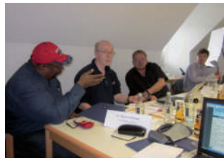
Fotos: Arbeitsgruppen bei früheren Seminaren in Montabaur