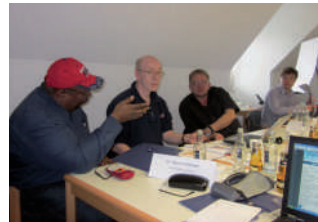
Fotos: Arbeitsgruppen bei früheren EBR-Grundseminaren