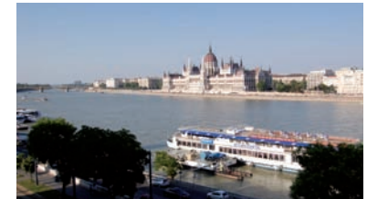
Blick aus dem Hotel auf die Donau

www.radissonhotels.com/de-de/hotels/artotel-budapest